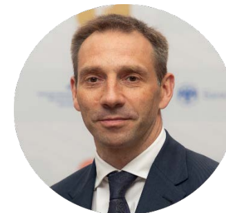
Сергей Беляков президент НАПФ

“ Чем выше охват населения корпоративными пенсионными программами, тем выше коэффициент замещения. Развитие таких механизмов является безальтернативным способом достижения высокого коэффициента замещения и повышения уровня пенсионного обеспечения в стране. Планируется 40% замещения к 2060 г. ”