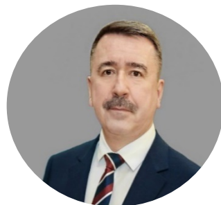
Сергей Черногаев председатель ФНПР

“ Чем выше охват населения корпоративными пенсионными программами, тем выше коэффициент замещения. Развитие таких механизмов является безальтернативным способом достижения высокого коэффициента замещения и повышения уровня пенсионного обеспечения в стране. Планируется 40% замещения к 2060 г. ”